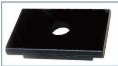
Piastra cacciaspine Press plate Abdrückplatte Plaque d'extraction Placa extractora de pasadores Stół do wyciskania sworzni