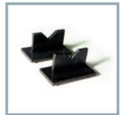
Prismi V-blocks Prismensatz Prismes à 'V' Prismas Pryzmy